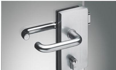
72 OFFICE Classic