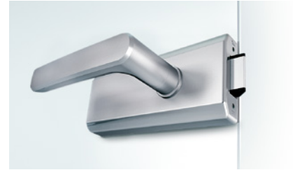
36 STUDIO Gala 2.0