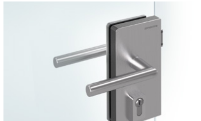
80 OFFICE Mundus