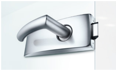
44 STUDIO Arcos