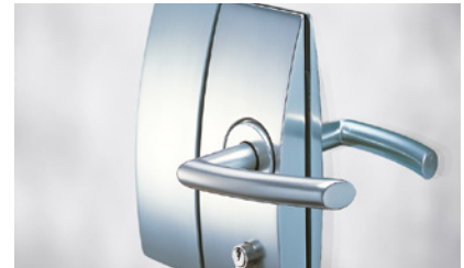
86 OFFICE Arcos