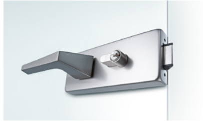
24 STUDIO Classic