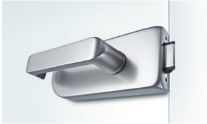
08 STUDIO Rondo