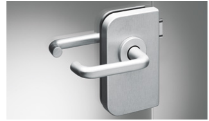
64 OFFICE Junior