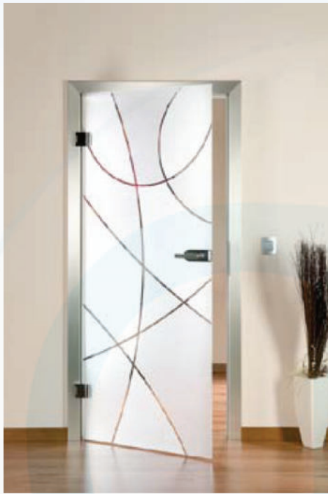
DIN links Ansicht*